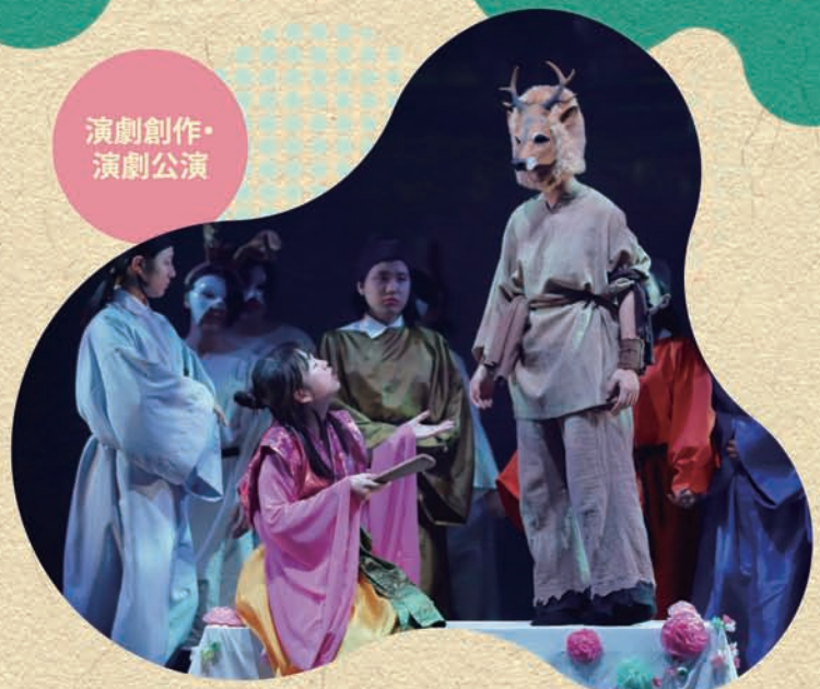
演劇創作・演劇公演